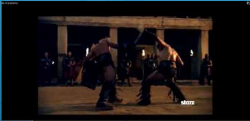
“Pão e circo”

Disponível em http://www.youtube.com/results?search_query=o+imperio+romano+parte+2&sm=3;