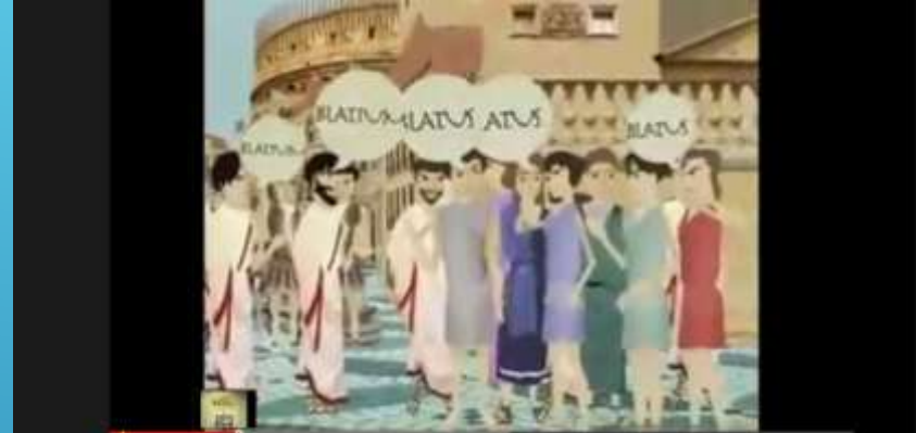
“Grandes civilizações: O Império romano parte 2 de 2”

Disponível em http://www.youtube.com/watch?v=2BiyZYEUEbE