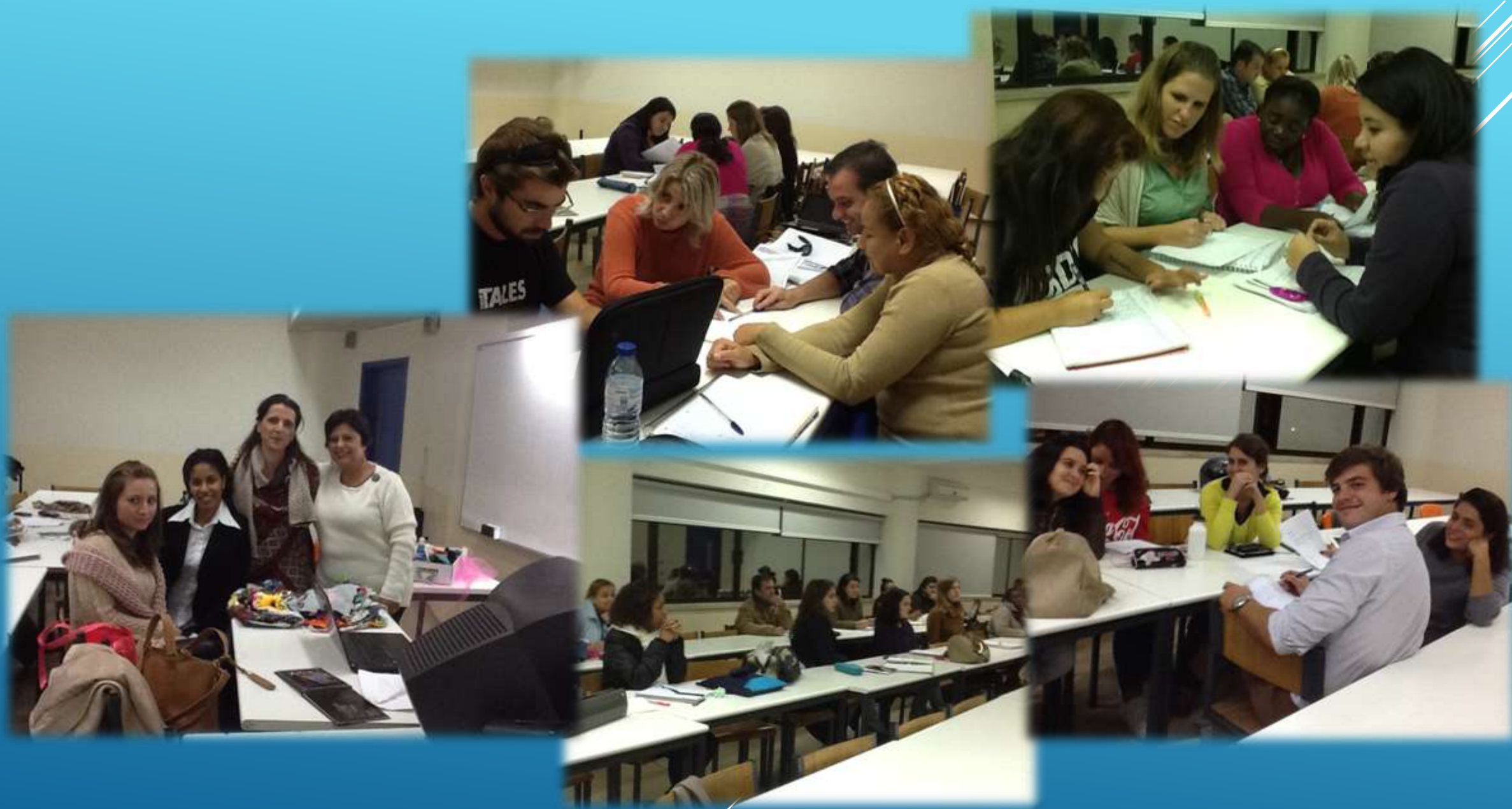
Международная летняя молодёжная школа «Поликультурная медиация в образовании» Институт педагогики, психологии и социологии Сибирский федеральный университет