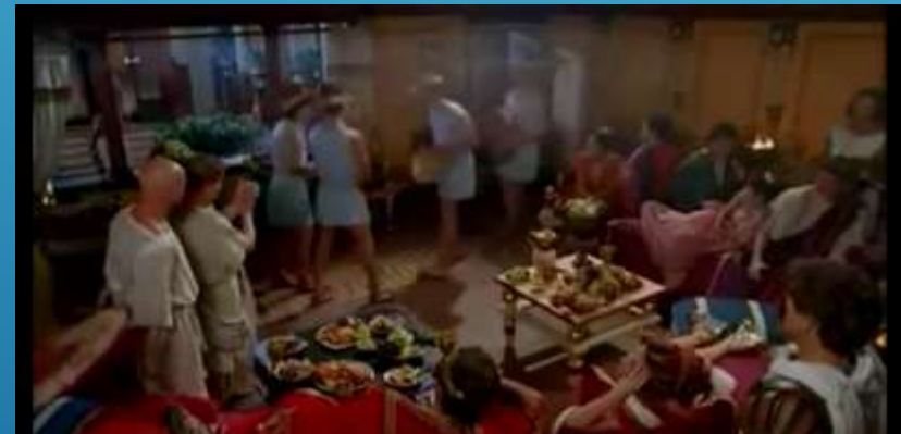
“Pompeia- a Fúria dos Deuses (Pompei - Stories from an Eruption )”

Disponível em http://www.youtube.com/watch?v=lhUcpHWzcBw