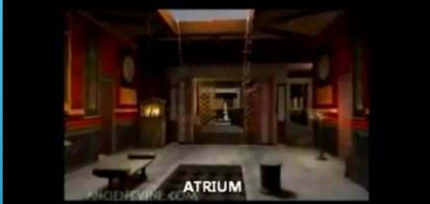
“La Domus Romana 3D (partes) ”

Disponível em http://www.youtube.com/watch?v=2BiyZYEUEbE