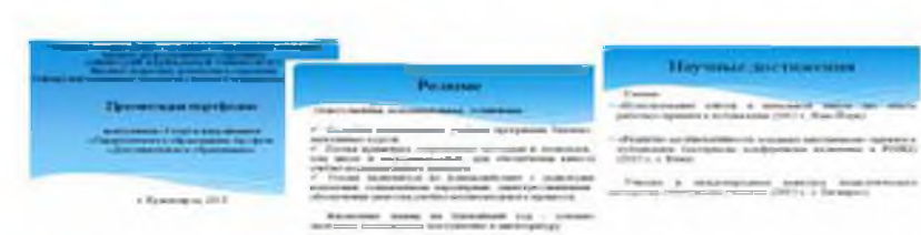
Рисунок 2 – Презентационное е-портфолио выпускника педагогического бакалавриата

Один из примеров презентационного е-портфолио выпускника педагогического бакалавриата представлен на рис. 2.