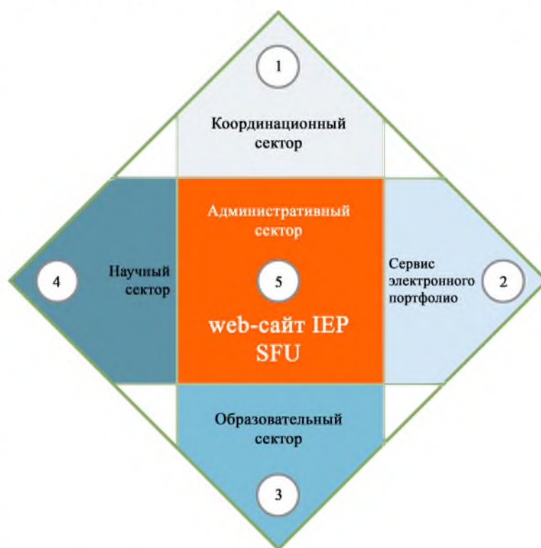
Рис. 1. Модель Поликультурной образовательной платформы

Интерактивное пространство 1 представлено коммуникационным сектором, поддерживающим продуктивный диалог между участниками образовательной платформы. Оно решает задачи интеграции Поликультурной образовательной платформы в информационную среду социума, в котором функционирует платформа. Выделим три основные функции, которые должны быть реализованы для успешного выстраивания продуктивной коммуникации в рамках платформы. Во-первых, привлечение представителей целевых групп к работе плат-