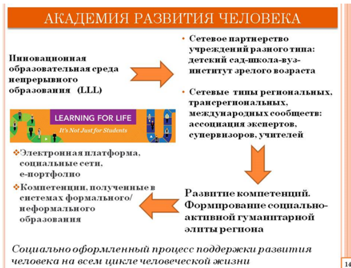
Рис. 5. Организационная структура функционирования Академии развития человека