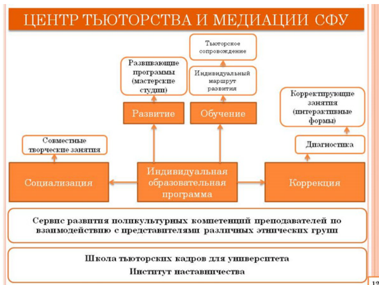
Рис. 3. Организационная модель центра тьюторства и медиации в федеральном университете

В качестве инновационной структуры реализации мониторинга деятельности преподавателя в федеральном университете в условиях непрерывного профессионального образования выступает Центр тьюторства и медиации. В нашем понимании, потенциал этого структурного подразделения состоит в его позиционировании как сервиса развития поликультурной компетенции преподавателей Сибирского федерального университета по взаимодействию с представителями различных этнических групп с учетом многонациональной специфики региона. Модель центра представлена на рис. 3.