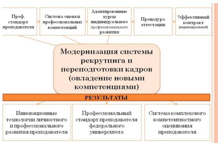
Рис. 1. Схема внедрения профессионального стандарта преподавателя федерального университета и его результаты

Нами предлагается следующая схема внедрения мониторинга деятельности преподавателя в федеральном университете в условиях непрерывного профессионального образования и модернизации системы рекрутинга преподавательских кадров в федеральном университете с целью овладения новыми компетенциями, ориентированной на ожидаемые результаты (рис. 1).