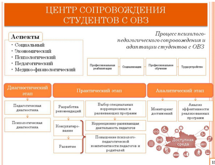
Рис. 4. Центр сопровождения студентов с ОВЗ

Целью Центра является создание специальных условий для обеспечения равного доступа к образованию обучающихся с ОВЗ и инвалидностью и сопровождение их на протяжении всего образовательного процесса (рис. 4).